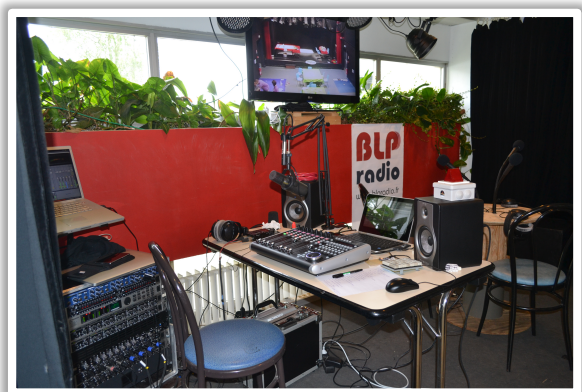
“Nuit de les jeux” – MJC Villebon (2016)

Nous sommes équipé de liaisons sans fil longue distance (<5Km à vue - WiFi 2.4Ghz), ce qui nous permet de capter le son de plusieurs scènes, ou réaliser des multiplex.